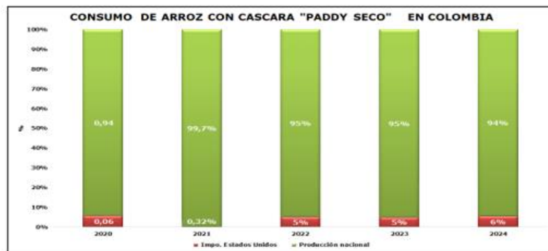
Gráfico 1. Consumo de arroz con cáscara "paddy seco" en Colombia entre 2020 y 2024.

Fuente: DIAN Y FEDEARROZ. Calculo: SPC - MinCIT.