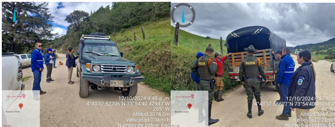
Ilustración uno. Puesto de control municipio La Calera.