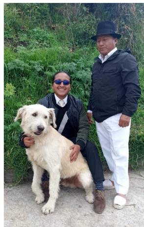
Ilustración 57.- Caso Benji