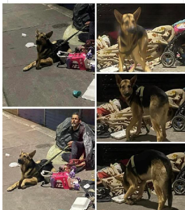
Ilustración 15.- Perro en mal estado de salud

Acaba de ver este perrito, me acerqué a regalarle comida y me di cuenta que se encuentra en muy mal estado de salud, tiene su patica fracturada y está en un alto grado de desnutrición, lo llevan unos venezolanos, les solicité que me lo regalen o que me lo vendan y se rehusaron a ello, favor las autoridades hagan algo por este animalito; Se encuentra junto a la Serviteca del éxito Avenida Panamericana