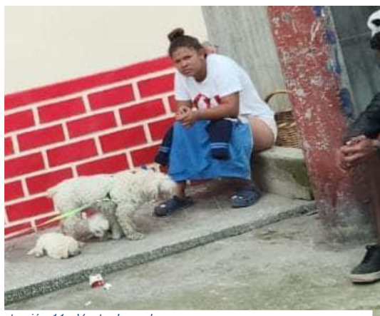
Ilustración 11.- Venta de cachorros

La siguiente imagen evidencia la venta de perros cachorros en la calle, situación recurrente con los animales por parte de la comunidad migrante, perras usadas para la reproducción.