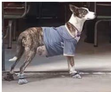
Ilustración 13.- Perra en estado de preñez y con almohadillas lastimadas

Muchas de ellas siguen caminando en estado de gestación y dan a luz en la calle