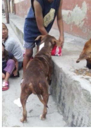
Ilustración 10.- Perras en celo

La gran mayoría de estas perras son explotadas sin importar sus condiciones, además de a venta de sus crías