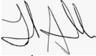
INTI RAÚL ASPRILLA REYES Senador de la República Ponente