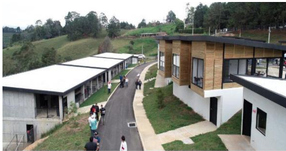
Santa Rosa de Lima