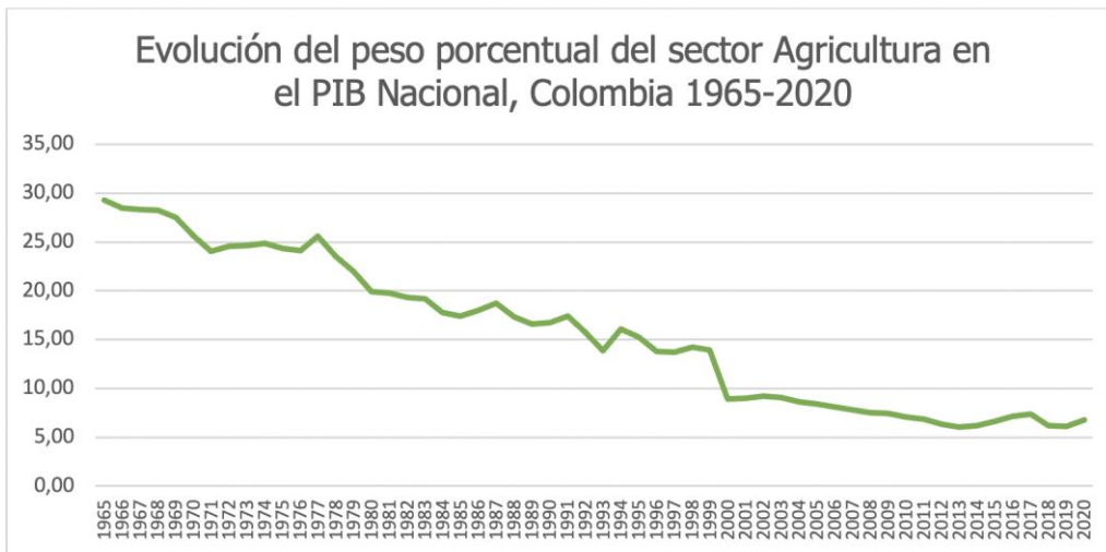
Cálculos propios.

El año pico de mayor destinación de recursos del Presupuesto General de la Nación fue el 2015, seguido por el 2013 y 2014, siendo estos tres años los únicos, durante los 21 en el que las apropiaciones superaron la barrera de los 3 billones de pesos. En contraste, la suma total de las apropiaciones presupuestales anuales del sector agricultura en Colombia entre 2000 y 2021 es equivalente al presupuesto del Ministerio de Defensa para 2021 (39,3 billones).